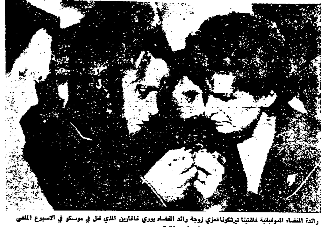
رائدة النساء الموندالية نالغينا نالغينا زوجة رائد القسام يوري غاغارين الذي قتل في موسكو في الاسبوع الماضي في حادث طائرة .